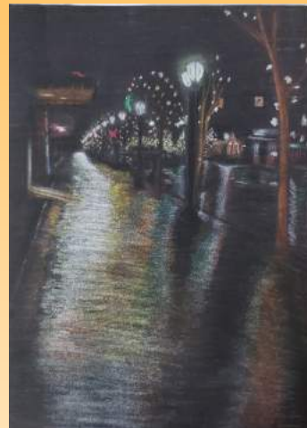
1º lugar tanto no júri popular quanto no júri técnico em 2009

A Fena incentiva os bancários da Caixa que também tem talentos com o concurso Talentos Fena. Itagiba já par-