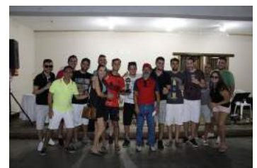
Bradesco - Vice-campeão