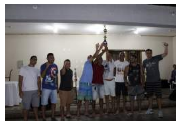
Banco do Brasil - Campeão 2019