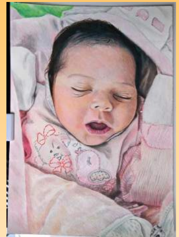
1º lugar na etapa estadual em 2018