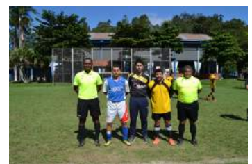
Equipe de arbitragem e capitães dos times