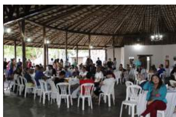
Momento de confraternização