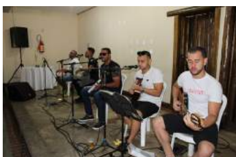
Banda do Cesinha