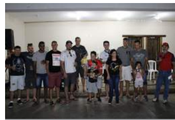
Santander - Terceiro Lugar